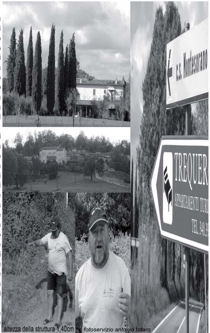
altezza della struttura 1,40cm