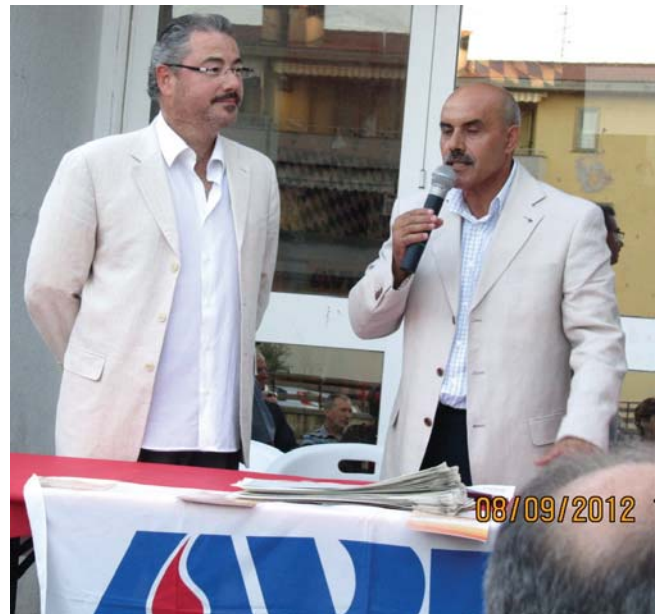
consegna attestati al merito trasfusionale 2012