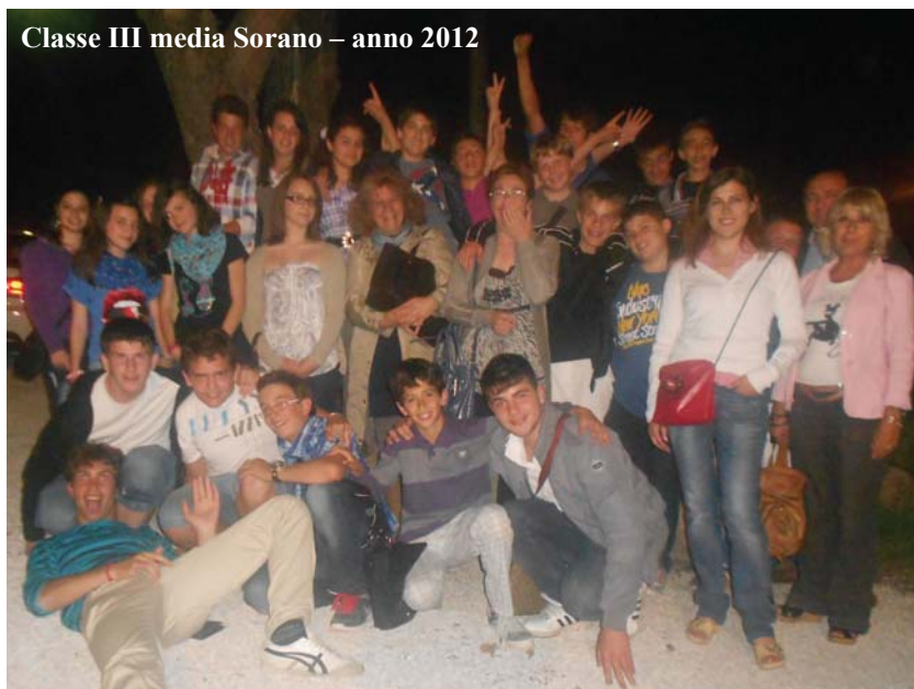
Classe III media Sorano – anno 2012

litigato e fatto pace. Resteranno sempre nel mio cuore perché sono stati parte integrante della mia infanzia ed adolescenza. Mentre scrivo queste righe l'esame di terza media è ormai concluso e io mi ritrovo a pensare con riconoscenza anche ai miei professori che sono stati un pilastro fondamentale in questi tre anni. Su qualcuno di loro ho potuto contare sempre, ho potuto confidarmi apertamente ed essere sostenuto con tanto affetto. Spero di trovare anche nella nuova scuola insegnanti così comprensivi, preparati e simpatici e io li ringrazio uno per