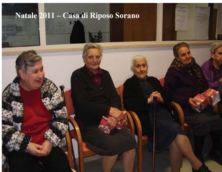
Natale 2011 – Casa di Riposo Sorano

La vigilia di Natale una rappresentanza della nostra AVIS Comunale è andata a far visita agli ospiti della Casa di riposo di Sorano. E' stato un momento di incontro, solidarietà e vicinanza con i nostri anziani che hanno dimostrato di gradire l'iniziativa. Abbiamo organizzato un bel rinfresco e consegnato ad ognuno un panettone, ma principalmente siamo andati per far loro gli auguri di buon Natale e stargli un po' vicino, cosa che hanno particolarmente gradito. Si i nostri nonni più che del panettone e del rinfresco hanno apprezzato la nostra compagnia, ci hanno raccontato della loro vita e in queste due ore che abbiamo trascorso insieme li abbiamo visti allegri e sereni. Tutti noi abbiamo bisogno di