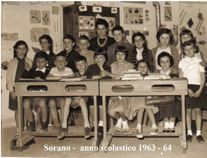
Sorano - anno scolastico 1963 - 64