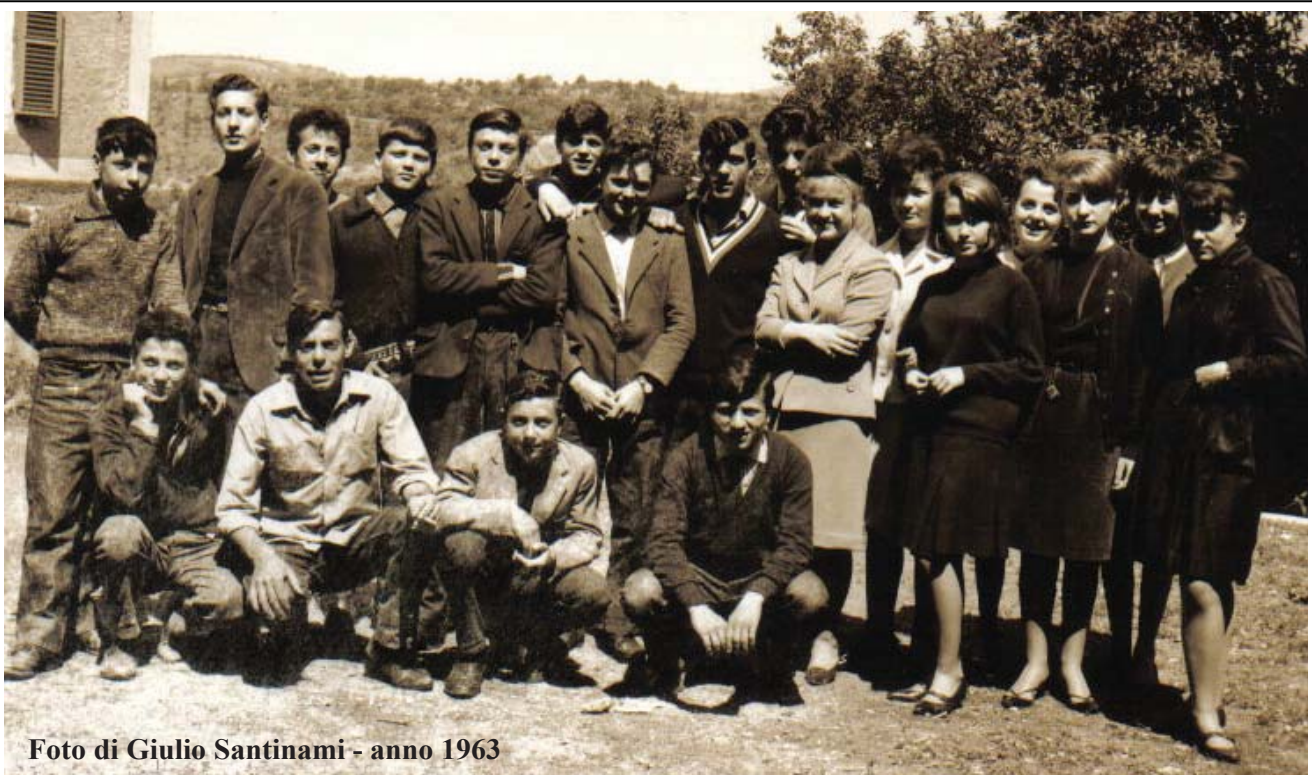
anno 1963