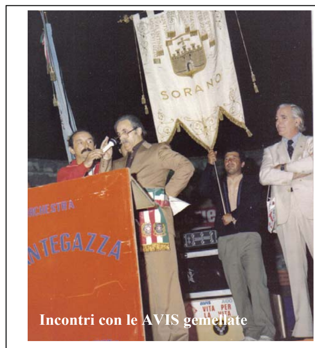
Incontri con le AVIS gemellate