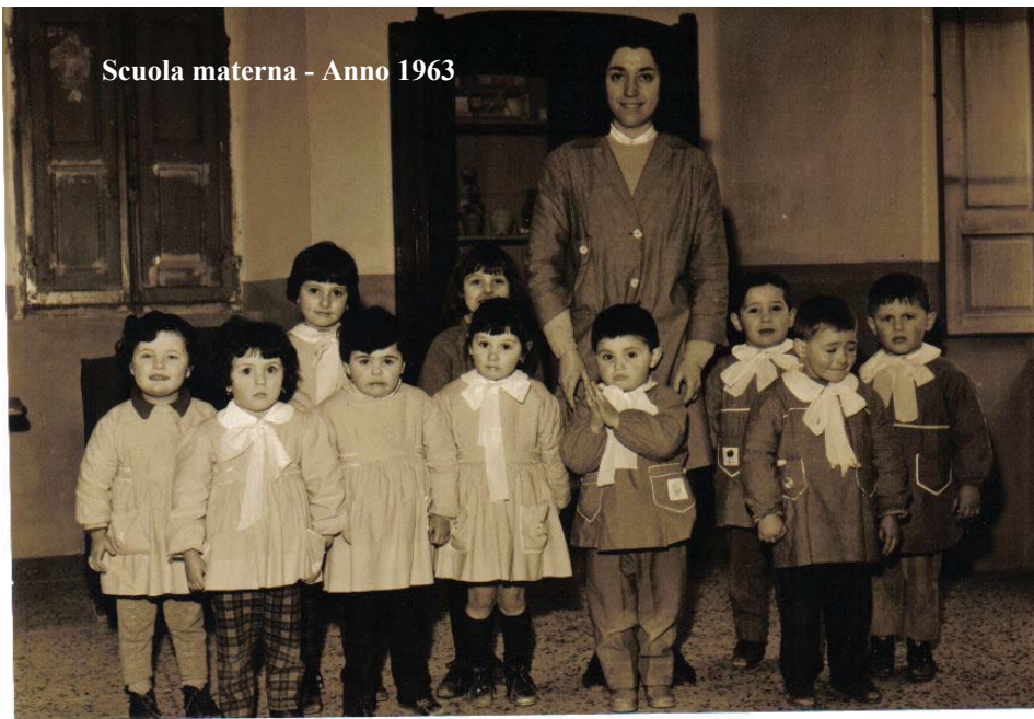
Scuola materna - Anno 1963