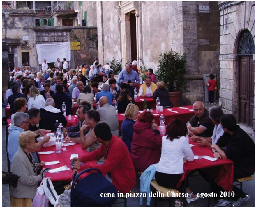
cena in piazza della Chiesa - agosto 2010

Venerdì 6 agosto ultimo scorso si è svolta come ormai è consuetudine la tradizionale cena del "Capacciolo" nella splendida cornice di Piazza della Chiesa. Anche quest'anno la partecipazione è stata veramente numerosa (oltre 150 persone). Ci scusiamo peraltro con tutti quelli che avrebbero voluto partecipare alla cena ma, per mancanza di spazio non hanno trovato posto. Questa affluenza così numerosa e il riscontro positivo che ancora incontra la "Voce del Capacciolo" ci riempiono di soddisfazione e ci incoraggiano ad andare avanti. I soldi raccolti con l'iniziativa ci permetteranno di affrontare serenamente le spese di stampa della "Voce" per tutto il prossimo