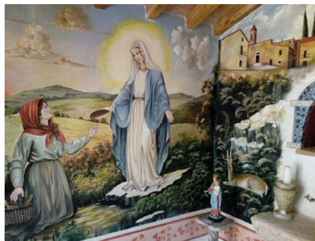
Cappellina di San Carlo affrescata dal Maestro Piero Berni