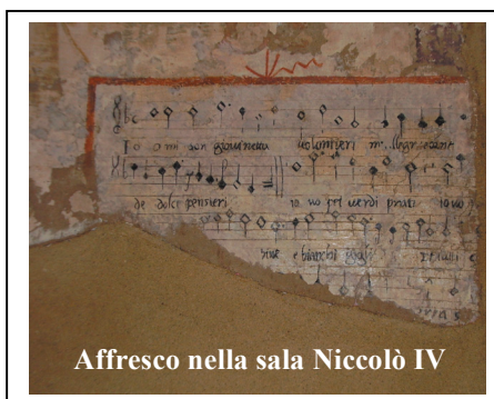
Affresco nella sala Niccolò IV

Il suo significato profondo dagli Orsini e il madrigale in solo un florilegio ameno o un questo potevano bastare le parole: artistica privilegiata in quel tempo, musica, per sua natura, vive solo doveva sicuramente echeggiare in tempi previsti dalle consuetudini Ferrabosco, inoltre, soggiornò più Cappella Giulia, senz'altro può anche credere che sia stato lui