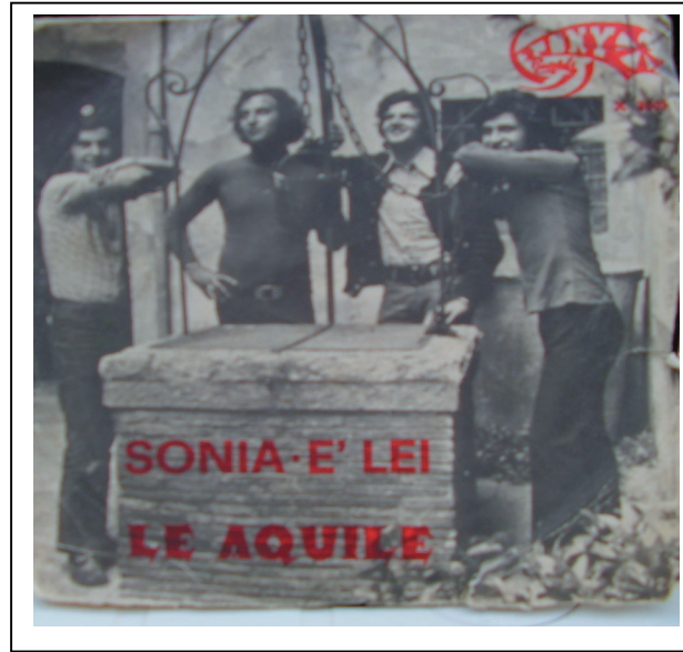
Copertina del disco "SONIA"

Con il passare del tempo si perfezionarono, e "Le Aquile" insediarono il proprio nido in quel di Castel Montorio, dove il sabato e la domenica si esibivano nella sala sempre gremita di appassionati del ballo e della musica. L'allora Parroco ascoltando le capacità musicali dei quattro capi che era giunto il momento per celebrare la SS. Messa accompagnato dall'allora musica "beat". La domenica, puntuali alle ore 11,30, le Aquile cantarono ed eseguirono nella Chiesa Parrocchiale il loro pezzo. Le perplessità di molti svanirono all'ascolto della bella musica Sacra che i quattro erano riusciti a perfezionare. Si esibirono anche in altre Parrocchie arrivando fino alla chiesa di Rocca di Papa, ottenendo una ovazione di meraviglia per le loro bravura. Il calendario degli impegni per le serate danzanti iniziò a riempirsi a dismisura; la casa discografica "Pony" li invitò ad incidere il loro primo disco "Sonia" lato A (...Sonia angelo mio, Sonia è qui con me, Sonia non è più un sogno, ma finalmente realtà...) e "E' Lei" lato B.