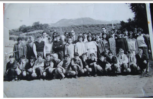
COME ERAVAMO..... belli!