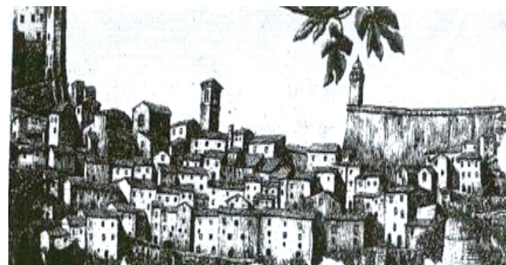
disegno di G. PELLEGRINI

...E quello cos'è? Non l'ho mai visto..- chiese la mia amica romana Sandra, in uno dei suoi svariati e amatissimi ritorni a Sorano.