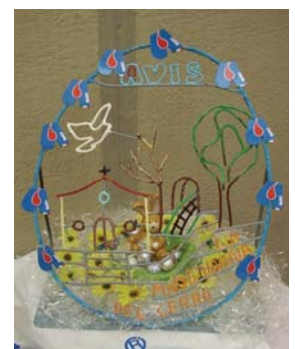
Realizzato da Pierluigi Domenichini