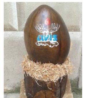
Realizzato da Serena e Rodolfo Nucciarelli