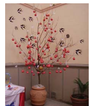
Albero del donatore di sangue