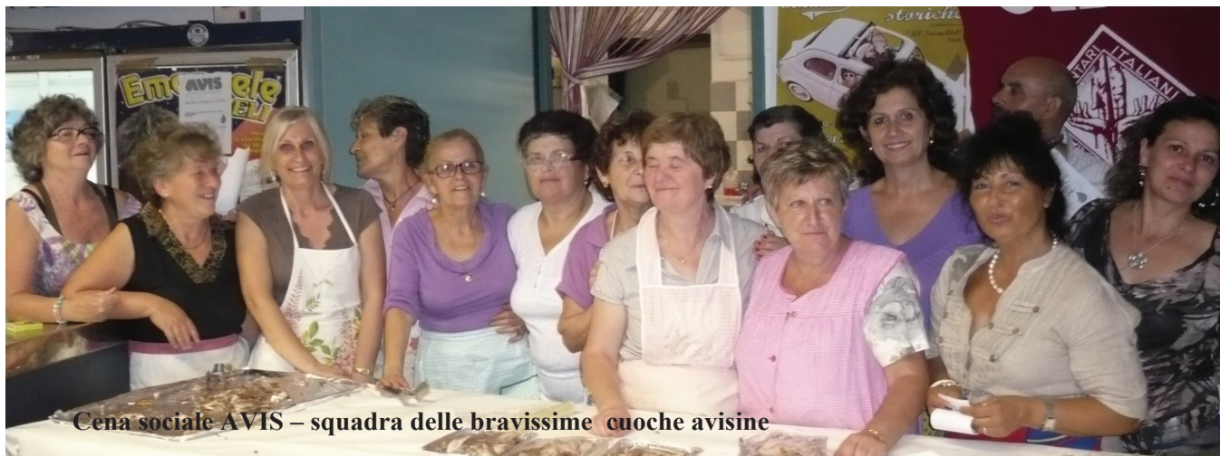
Cena sociale AVIS – squadra delle bravissime cuoche avisine