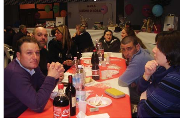
Cena sociale Avis – S. Quirico 26.2.2011