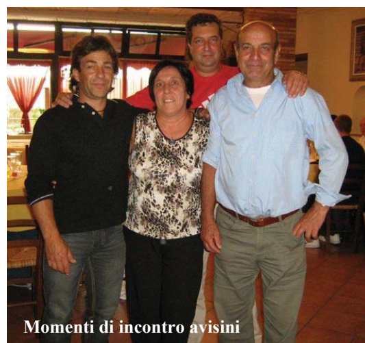
Momenti di incontro avisini

Purtroppo la percentuale tra popolazione e donatori attivi nel territorio è ancora relativamente bassa. Allo scopo di avvicinare un numero sempre maggiore di persone alla pratica della donazione del sangue, questa AVIS sta mettendo in campo una serie di iniziative/attività di comunicazione promozionale che vanno ad abbracciare diversi campi: riunioni, momenti sportivi, sito web, uso di bacheche, incontri, notiziario AVIS, distribuzione di pieghevoli /opuscoli informativi ecc. Ultimamente, grazie alla disponibilità di un gazebo che ci è stato regalato, stiamo intensificando la presenza e visibilità dell'Associazione sul territorio con lo scopo di: favorire nuove iscrizioni e rinforzare le motivazioni di coloro che sono già soci. Nel mese di giugno abbiamo aperto dei punti informativi AVIS in occasione del saggio di ballo presentato a Sorano il 5 giugno 2010 e successivamente nel corso della prima mostra mercato svolta a S. Quirico nei giorni 12 e 13 giugno 2010. Tutte queste attività sembrano facili, invece, richiedono impegno e disponibilità ma l'aver registrato l'iscrizione di due nuovi aspiranti donatori di sangue durante quest'ultime attività svolte, ci ripaga ampiamente del sacrificio fatto.